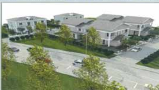
VEDI PROSPETTIVA TIPOLOGIA BIFAMILIARE E QUADRIFAMILIARE