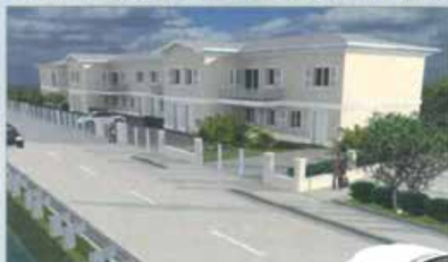
VEDI PROSPETTIVA APPARTAMENTI

REALIZZAZIONE DI VILLETTE BIFAMILIARI, QUADRIFAMILIARI E APPARTAMENTI. CON GIARDINO ED INGRESSO INDIPENDENTE COSTRUZIONI CON FINITURE DI PREGIO CON IMPIANTISTICA DI NUOVA CONCEZIONE PER IL RISPARMIO ENERGETICO